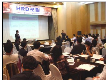
▶ 회원간 HRD정보교류