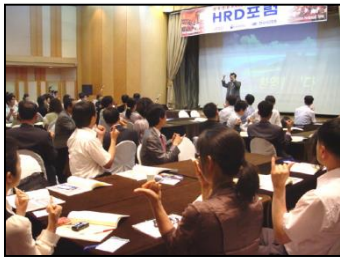
▶ 매월 1회 HRD포럼 개최

매월 이슈주제 계획에 의하여 테마에 대한 분야 최고의 전문가 특강과 우수사례 발표, 참석회원 상호간 정보를 교류합니다.